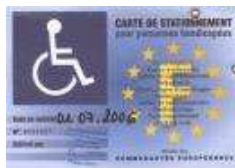
carte européenne de stationnement

Une place de stationnement handicapé est réservée aux personnes à mobilité réduite (voir plan ci-dessous). Le véhicule doit être identifié par la carte européenne de stationnement, le macaron GIC (grand invalide civil) ou GIG (grand invalide de guerre) en cours de validité.